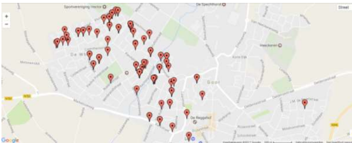
Voedingsgebied KBS De Albatros, 13 februari 2017

Basisschool de Albatros verzorgt sinds 1973 katholiek onderwijs in de wijk de Whee. De school staat op het onderwijseland tussen de Kievitstraat en de Scherpenzeelseweg. De school is een middelgrote school, die basisonderwijs verzorgt aan kinderen van 4 t/m 12 jaar. De meeste kinderen komen uit de wijken rondom de school.